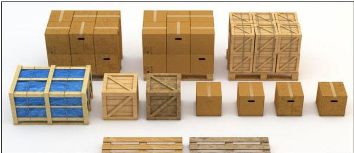
Fig §2 - Logistique, de conteneur à palette, de vente pour grossiste à la revente au détail.

① Inventaire ② Emballage ③ Gestion des commandes ④ Expédition ⑤ Prévisions