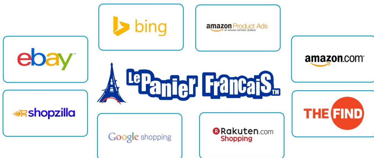
Fig §3 - Le Panier Français et la présence numérique.

① Marketing Digital ② Optimization ③ Insertion ④ Publication ⑤ Test