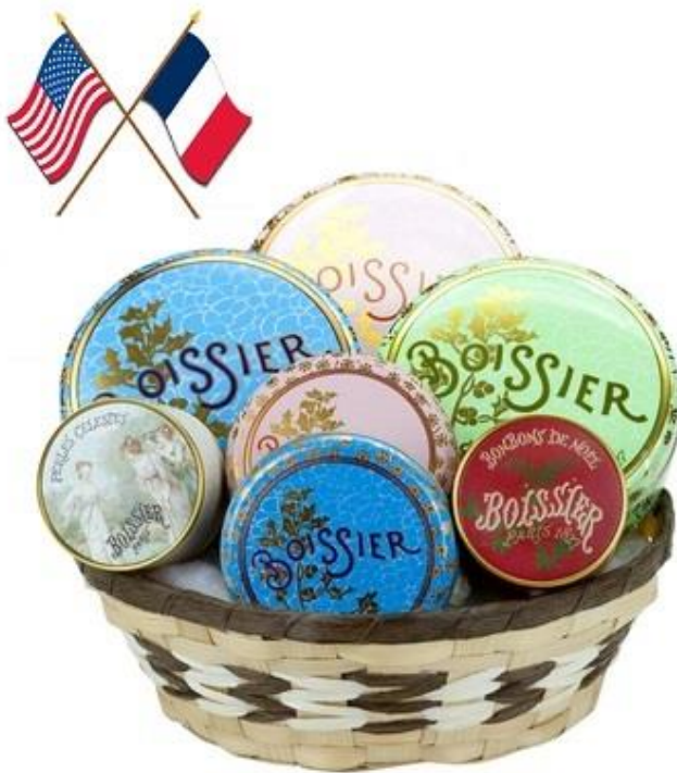
Exemple de Panier Garni

"Vous loupez 100% des tirs que vous n'essayez pas" Gretsky, Joueur professionnel de hockey US.